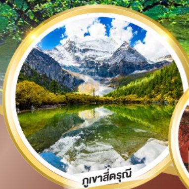
ภูเขาสีดรุณี