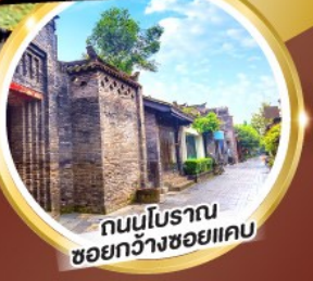
ถนนโบราณ ชอยกวางชอยแคบ