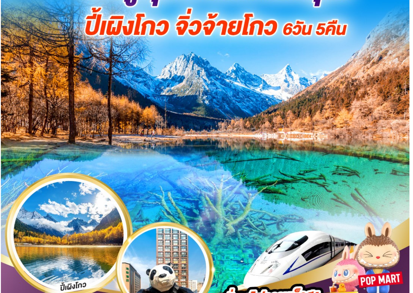
ปีเหมิงโกว