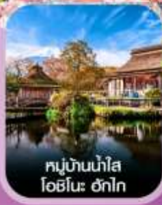
หมู่บ้านน้ำใส โอชิโนะ ฮักไก