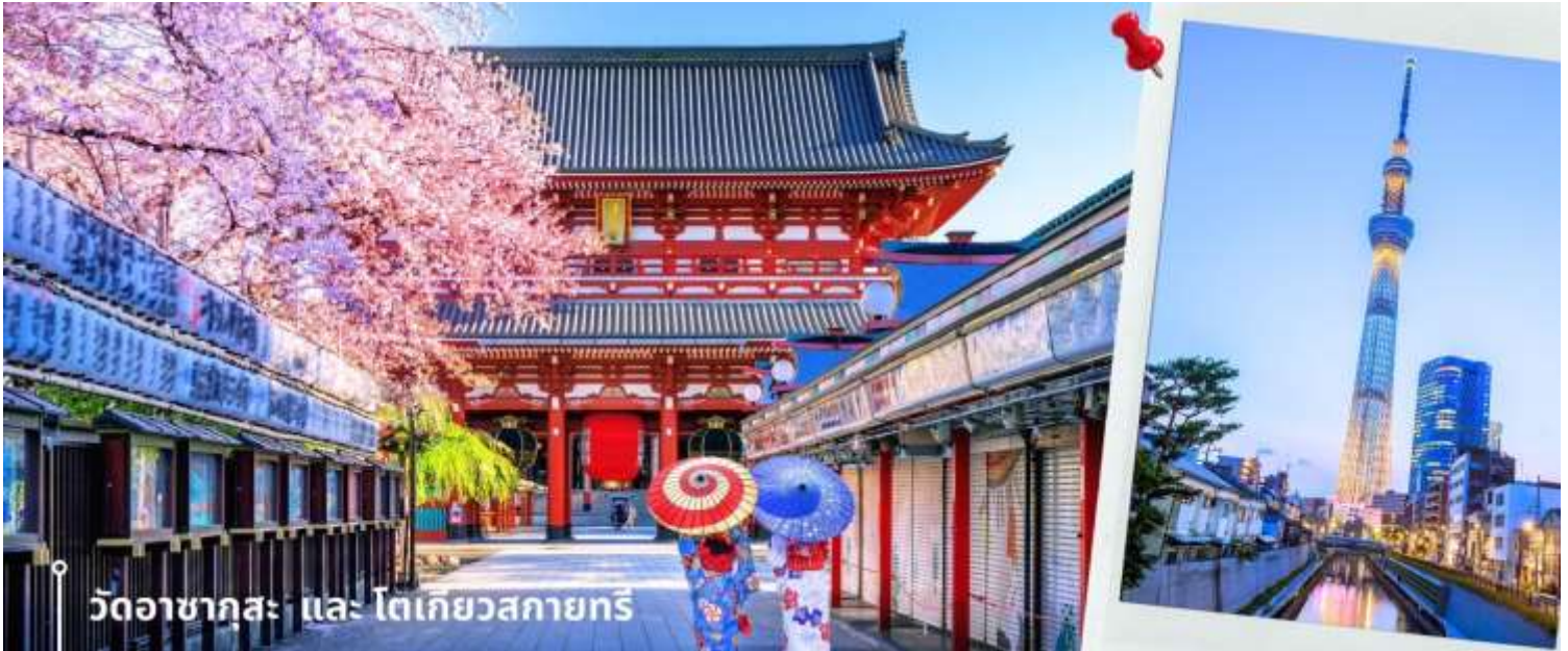
วัดอาซากุสะ และ โตเกียวสกายทรี

ความสูง 4.5 เมตร ซึ่งแขวนห้อยอยู่ ณ ประตูทางเข้าที่อยู่ด้านหน้าสุดของวัดที่มีชื่อว่า “ประตูฟ้าคำรณ” บริเวณทางเข้าสู่ตัววิหารจะมี “ถนนนากามิเซะ” ซึ่งเป็นที่ตั้งของร้านค้าขายของที่ระลึกพื้นเมืองต่างๆ มากมาย เช่น หน้ากาก ของเล่น รองเท้า พวงกุญแจ ของที่ระลึก และขนมมานาชนิดที่เมลอนปังในตำนาน ดังโงะหนึบหนับและน่องปลาขนมไทยากิ ฯลฯ ให้ทุกท่านได้เลือกซื้อเป็นของฝากของที่ระลึก จากนั้นนำท่านถ่ายรูปกับ “TOKYO SKYTREE” (ด้านนอก) ที่บริเวณสะพานข้ามแม่น้ำสุมิดะหนึ่งในแลนด์มาร์คของโตเกียว เป็นหอคอยส่งสัญญาณโทรทัศน์ที่เป็นสิ่งปลูกสร้างที่สูงที่สุดในญี่ปุ่น และเป็นหอคอยที่สูงที่สุดในโลกตั้งอยู่ที่เขตสุมิดะหน้าที่หลักของโตเกียวสกายทรีคือการกระจายสัญญาณสื่อสารแบบดิจิทัลนั่นเอง และโตเกียวสกายทรียังแทรกความเป็นมาของท้องถิ่นเอาไว้ด้วยความสูงของหอคอยที่ 634