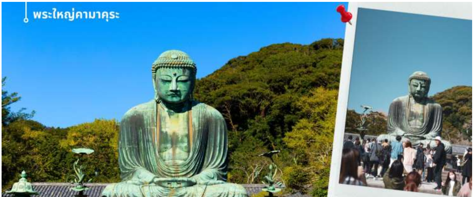
พระใหญ่คามาคูระ

หลังรับประทานอาหารเที่ยง เดินทางสู่ เมืองคามาคูระ พาท่านเข้าชม พระใหญ่คามาคูระ (Kamakura Daibutsu หรือ The Great Buddha) เป็นพระพุทธรูปที่สำคัญที่สุดในเมืองคามาคูระ ตั้งอยู่ในวัดโคโตะกุอิน (Kotokuin Temple) พระพุทธรูปโคบุตสึมีความสูงถึง 13.35 เมตร น้ำหนัก 95 ตัน เป็นพระพุทธรูปที่ใหญ่เป็นอันดับสองในญี่ปุ่น รองจาก หลวงพ่อโต แห่งวัดโทไดจิ เมืองนารา จากหลักฐานพบว่าพระใหญ่โคบุตสึสร้างขึ้นในปี ค.ศ. 1252 ในตอนแรกนั้น พระพุทธรูปอยู่ในห้องโถงของวัด แต่ตัววัดได้รับความเสียหายจากพายุและแผ่นดินไหว อยู่หลายครั้ง จนในที่สุดไม่มีตัวอาคารของวัด พระใหญ่โคบุตสึจึงได้ตั้งอยู่กลางแจ้ง รับชมความงามของซากุระฤดูใบไม้ผลิภายในวัด