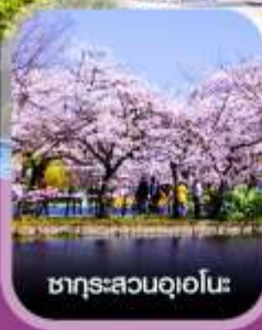
ซากุระสวนอุเอโนะ

คอนเฟิร์มออกเดินทาง ทุกพีเรียด 2 ท่านขึ้นไป