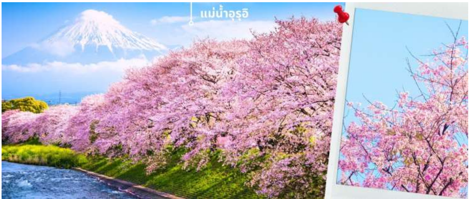
แม่น้ำอุรุอิ

หลังรับประทานอาหารเที่ยงนำท่านเดินทางสู่ แม่น้ำอุรุอิ Urui River อยู่ที่จังหวัด Shizuoka ถือเป็นอีกหนึ่งจุดชมดอกซากุระที่บรรดานักถ่ายภาพต่างพากันไปในช่วงต้นเมษายน เพราะจะได้เห็นวิวซากุระบานยาวตลอดริมแม่น้ำพร้อมกับฉากหลังเป็นภูเขาฟูจิ