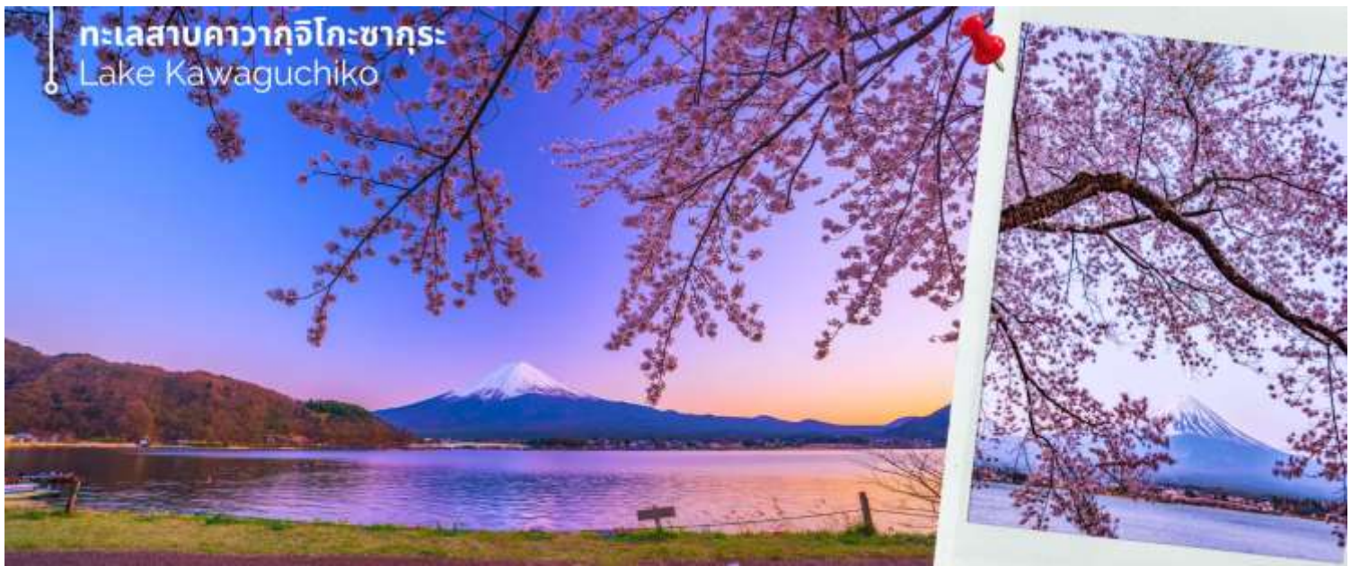
ทะเลสาบคาวากุจิโกะซากุระ Lake Kawaguchiko

** ระยะเวลาการบานของดอกซากุระจะขึ้นอยู่กับสายพันธุ์และสภาพอากาศ **