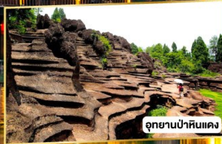
อุทยานป่าหินแดง