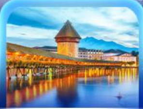
สะพานไมซ์าเปลา