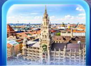
จัตุรัสมาเรียนพลัทซ์

เวียนนา ปราสาทนอยชวานสไตน์ ลูเซิร์น ซอร์แมท ชุก ซูริก