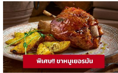
พิเศษ!! ขาหมูเยอรมัน

จากนั้นนำท่านเดินทางสู่ เมืองลูเซิร์น (Lucerne) (ระยะทาง 300 กม. /4.30 ชั่วโมง) เมืองท่องเที่ยวยอดนิยมอันดับหนึ่งของสวิตเซอร์แลนด์ ที่ถูกห้อมล้อมไปด้วยทะเลสาบและขุนเขา นำท่านชม สิงโตหินแกะสลัก (Dying Lion of Lucerne) ที่แกะสลักบนพาหินธรรมชาติ เพื่อเป็นอนุสรณ์รำลึกถึงการสละชีพอย่างกล้าหาญของทหารสวิสที่เกิดจากการปฏิวัติในฝรั่งเศส ชมสะพานไม้ชาเปล (Chapel Bridge) ทอดข้ามผ่าน แม่น้ำรอยส์ ซึ่งเป็นเหมือนสัญลักษณ์ของเมืองลูเซิร์นเป็นสะพานไม้ที่มีหลังคาที่เก่าแก่ที่สุดในยุโรป สร้างขึ้นเมื่อปี ค.ศ.1333 โดยใต้หลังคาคลุมสะพานมีภาพวาดประวัติศาสตร์ของชาวสวิสตลอดแนวสะพาน