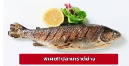
พิเศษ!! ปลาเทราต์ย่าง

บริเวณ จตุรัสมาเรียนพลาทซ์ (Marienplatz) จตุรัสกลางใจเมืองในเขตเมืองเก่า ปัจจุบันที่เป็นเหมือนพื้นที่สำหรับงานพิธีต่างๆ ที่สำคัญของเมือง ถัดมาเป็น ศาลาว่าการใหม่ (New Town Hall) ที่ได้ใช้ทำการแทนศาลาว่าการเก่าตั้งแต่ปี 1874 เห็นได้ง่ายด้วยหอคอยแหลมสูงและการออกแบบและตกแต่งอย่างประณีตไม่แพ้ปราสาทหรือพระราชวัง บริเวณใกล้กันนั้นเป็น ศาลาว่าการเก่า (Old Town Hall) เป็นอาคารสีขาวสะอาดหลังนี้เป็นศาลาว่าการของเมืองมิวนิกมาตั้งแต่ปี 1310 แม้จะผ่านมากกว่า 700 ปี แต่ก็ยังสวยและสง่า สัญลักษณ์แห่งการฟื้นคืนชีพ มหาวิหารเฟราเอน (Frauenkirche) หรือที่รู้จักกันในชื่อ โบสถ์แม่พระเดรสเดน เป็นหนึ่งในแลนด์มาร์คที่โดดเด่นที่สุดของเมืองเดรสเดน ประเทศเยอรมนี โบสถ์หลังนี้มีประวัติศาสตร์อันยาวนานและน่าสนใจ จากนั้นให้ท่านอิสระเดินเล่น หรือช้อปปิ้งสินค้าแบรนด์เนมตามอัธยาศัย