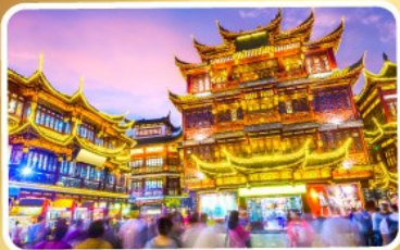
ตลาดร้อยปีเจิ้งหวังเมี่ยว