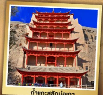
ต้าเกะสลักม่อเกา