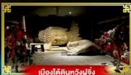
เมืองใต้ดินหวงฝูจิ่ง