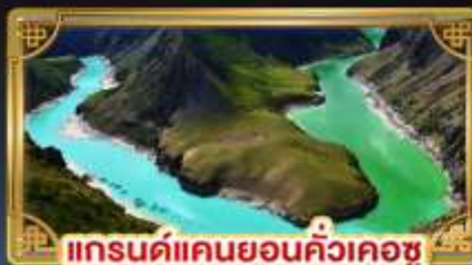
แกรนด์แคนยอนคิ้วเคอซู