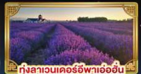
ทุ่งลาเวนเดอร์อีฟาอ้อฮิน