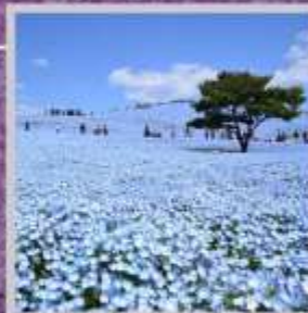
"HITACHI SEASIDE PARK"