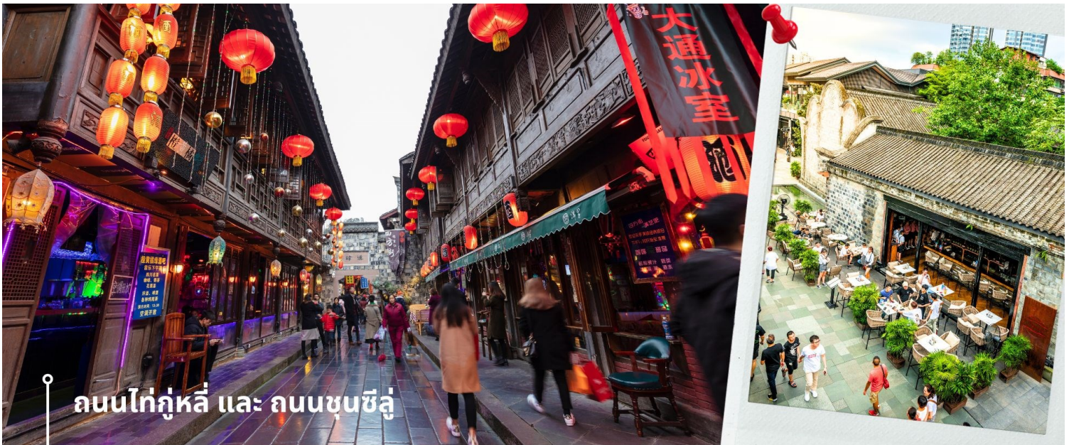
ถนนไท่กู่หลี่ และ ถนนซุนซีลู่

จากนั้นให้ท่านให้อิสระกับการเลือกซื้อสินค้าของฝากที่ ถนนไท่กู่หลี่ และ ถนนซุนซีลู่ ในย่านนี้เป็นถนนโบราณ ในอดีตเคยโรงงานผลิตผ้าไหมใหญ่ที่สุดในจีน ปัจจุบันได้เปลี่ยนเป็นถนนช้อปปิ้งแหล่งสวรรค์ของนักท่องเที่ยว เป็นถนนคนเดิน มีห้างสรรพสินค้าชื่อดัง มีร้านค้ามากกว่า 700 ร้านค้าที่เต็มไปด้วยสินค้าต่าง ๆ ทั้งร้านค้าแฟชั่น ร้านอาหารและโรงแรมนานาชาติมากมายซึ่งเป็นที่เที่ยวเชิงตุ่ที่มีการเชื่อมต่อทางวัฒนธรรมท้องถิ่นที่เป็นแหล่งช้อปปิ้งและเป็นแหล่งร้านอาหารที่อร่อยต่าง ๆ มากมาย ซึ่งเป็นสถานที่เที่ยวของเชิงตุ่ที่ทำให้เพลิดเพลินกับสินค้าแบรนด์เนมและแบรนด์จีน