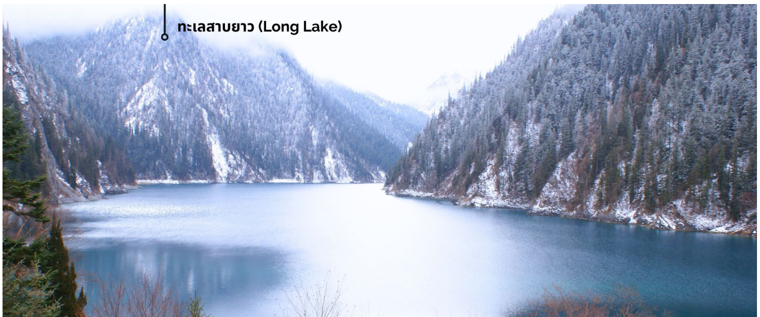
📍 ทะเลสาบยาว (Long Lake)

ทะเลสาบที่ใหญ่ที่สุด สูงที่สุด และลึกที่สุดในจิวจ้ายโกว ด้วยเนื้อที่กว่า 581 ไร่ ความยาวกว่า 7 กิโลเมตร และลึกถึง 103 เมตร ทอดตัวโค้งเป็นรูปพระจันทร์เสี้ยว เนื่องจากหิมะบนภูเขาละลายลงมา น้ำในทะเลสาบสีฟ้าสวยงาม ล้อมรอบด้วยยอดเขาสูงชัน และต้นไม้้น้อยใหญ่ที่ปกคลุมด้วยหิมะ งดงามราวหลุดออกมาจากภาพวาด ความพิเศษในช่วงฤดูหนาว ทะเลสาบจะกลายเป็นน้ำแข็งหนากว่า 60 เซนติเมตร ทำให้นักท่องเที่ยวนิยมมาเล่นสเก็ตน้ำแข็งกันเป็นจำนวนมาก