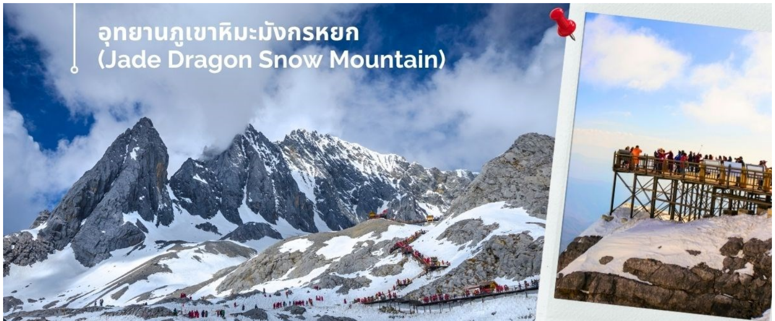
อุทยานภูเขาหิมะมังกรหยก (Jade Dragon Snow Mountain)

นำท่านชม อุทยานภูเขาหิมะมังกรหยก (Jade Dragon Snow Mountain) (รวมค่ากระเช้าใหญ่ ขึ้น-ลง) สู่จุดชมวิว ภูเขาหิมะมังกรหยก สูงจากระดับน้ำทะเล 4,506 เมตร ตั้งอยู่ในเขตปกครองตนเอง Yulong Naxi เมืองลี่เจียง มณฑลยูนนาน เป็นหนึ่งในสถานที่ท่องเที่ยวระดับ 5A เป็นอุทยานธรณีธารน้ำแข็งแห่งชาติ ครอบคลุมพื้นที่ 415 ตารางกิโลเมตร และภูเขาหิมะมีลักษณะเป็นลูกคลื่นและมีลักษณะคล้ายมังกรเงินที่บินได้ตั้งนั้นจึงได้ชื่อว่าภูเขาหิมะมังกรหยก ยอดเขาหลัก ชานจีโต่ว อยู่สูงจากเหนือระดับน้ำทะเล 5,596 เมตร ล้อมรอบด้วยเมฆและหมอกตลอดทั้งปี เป็นยอดเขาบริสุทธิ์ที่ไม่มีใครพิชิตได้ ภูเขาหิมะมังกรหยกเป็นหนึ่งในจุดชมวิวที่มีชื่อเสียงในลี่เจียงและเป็นภูเขาศักดิ์สิทธิ์ในใจของชาวนาซี มียอดเขาทั้งหมด 13 ยอด อุทยานไปด้วยทรัพยากรการท่องเที่ยวทางธรรมชาติ