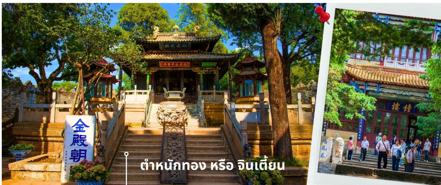
ตำนานทอง หรือ จินเตี้ยน

นำท่านเยี่ยมชม ตำนานทอง หรือ จินเตี้ยน (The Golden Temple Park | Jindian park) ( ไม่รวมค่ารถแบตเตอร์รี่ 10 หยวน/ท่าน ) โบราณสถานสำคัญของมณฑลยูนนาน ที่ได้รับการปกป้องดูแลโดยรัฐบาลจีน ตั้งอยู่บริเวณเชิงเขาหมิงเฟิง ล้อมรอบด้วยแนวกำแพงและหอคอยเหมือนเป็นป้อมปราการ ตำนกทองถูกเรียกตามลักษณะอาคารที่มีสีทองอร่าม จากทองเหลืองในส่วนของผนังและหลังคา รวมกว่า 200 ตัน โดยถือเป็นสิ่งปลูกสร้างสัมฤทธิ์ที่ใหญ่ที่สุดของจีน ภายในมีรูปปั้นทองโดยมีเงินอยู่ (เสวียนอู่) เทพเจ้าลัทธิเต๋าเป็นองค์ประธาน