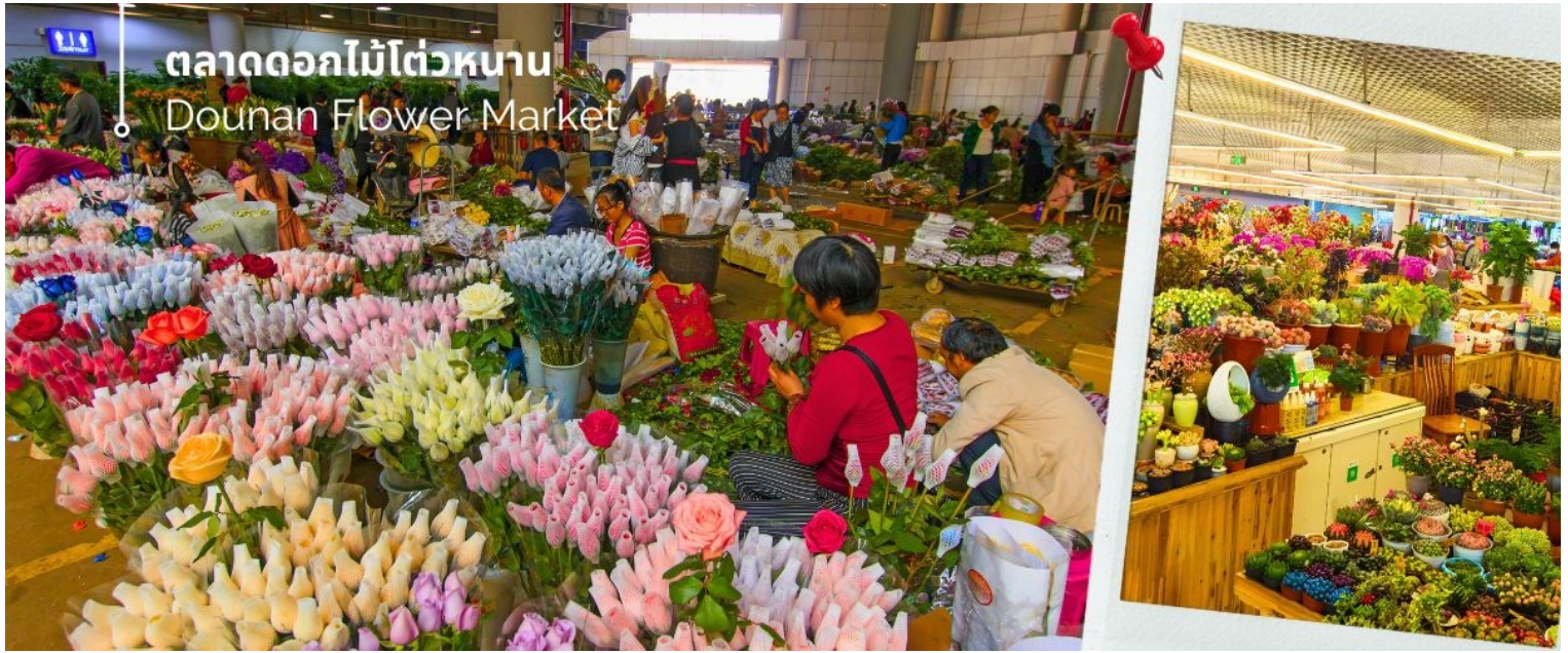
ตลาดดอกไม้ไต้หวัน Dounan Flower Market

นำท่านชม วัดหยวนทอง (Yuantong Temple) วัดแห่งนี้เป็นวัดที่ใหญ่และเก่าแก่ที่สุดในเมืองคุนหมิง สร้างมาตั้งแต่สมัยราชวงศ์ถัง มีอายุยาวนานประมาณ 1,200 กว่าปี การสร้างวัดแห่งนี้จะแปลกตากว่าวัดอื่นในจีน เพราะปกติแล้วการสร้างวัดของจีนส่วนมากจะต้องสร้างอยู่บนภูเขา แต่วัดหยวนทองสร้างวัดต่ำกว่าภูเขา โดยวิหารจะอยู่ต่ำที่สุด เนื่องจากวัดแห่งนี้ไม่ได้สร้างขึ้นเพื่อเป็นวัดโดยตรง แต่เคยเป็นศาลเจ้าแม่กวนอิมมาก่อน