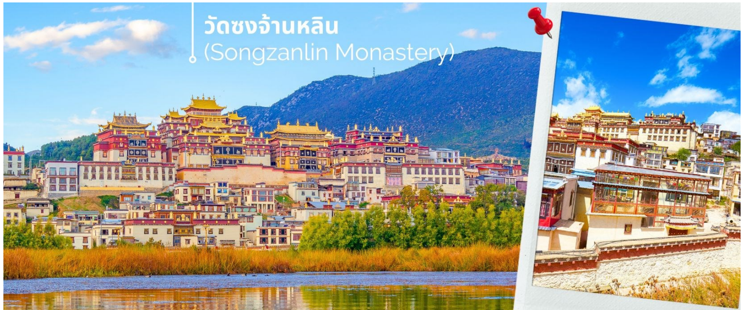
วัดซงจ้านหลิน (Songzanlin Monastery)

เช้า ๑๐ รับประทานอาหารเช้า ณ ห้องอาหารโรงแรม (6)