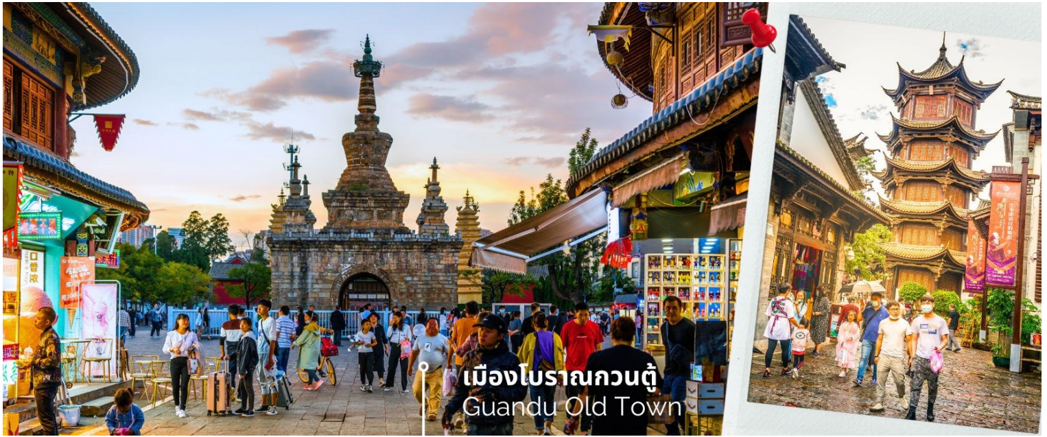
เมืองโบราณกวนตุ๋ Guandu Old Town

นำท่านชมบรรยากาศ เมืองโบราณกวนตุ๋ (Guandu Old Town) เป็นหนึ่งในต้นกำเนิดของวัฒนธรรมยูนนาน และยังถือเป็นหนึ่งในภูมิทัศน์ทางประวัติศาสตร์และวัฒนธรรม ที่สำคัญของเมืองคุนหมิง เมืองโบราณแห่งนี้ยังคงเป็นศูนย์กลางทางการค้าและคมนาคมที่สำคัญ ในอดีตเคยเป็นหมู่บ้านชาวประมงในสมัยราชวงศ์ถัง เมืองกวนตุ๋ยังเป็นเมืองแรกๆ ที่