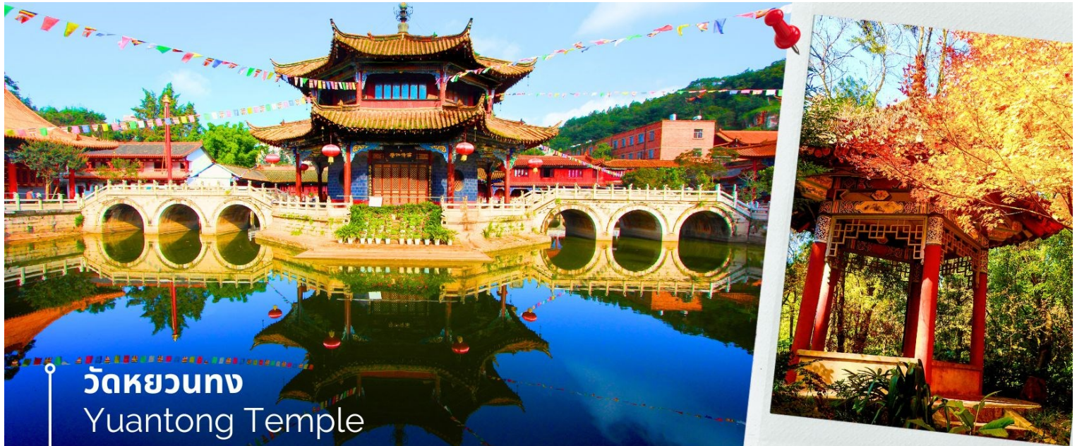
วัดหยวนทอง Yuantong Temple

นำท่านชม วัดหยวนทอง (Yuantong Temple) วัดแห่งนี้เป็นวัดที่ใหญ่และเก่าแก่ที่สุดในเมืองคุนหมิง สร้างมาตั้งแต่สมัยราชวงศ์ถัง มีอายุยาวนานประมาณ 1,200 กว่าปี การสร้างวัดแห่งนี้จะแปลกตากว่าวัดอื่นในจีน เพราะปกติแล้วการสร้างวัดของจีนส่วนมากจะต้องสร้างอยู่บนภูเขา แต่วัดหยวนทองสร้างวัดต่ำกว่าภูเขา โดยวิหารจะอยู่ต่ำที่สุด เนื่องจากวัดแห่งนี้ไม่ได้สร้างขึ้นเพื่อเป็นวัดโดยตรง แต่เคยเป็นศาลเจ้าแม่กวนอิมมาก่อน