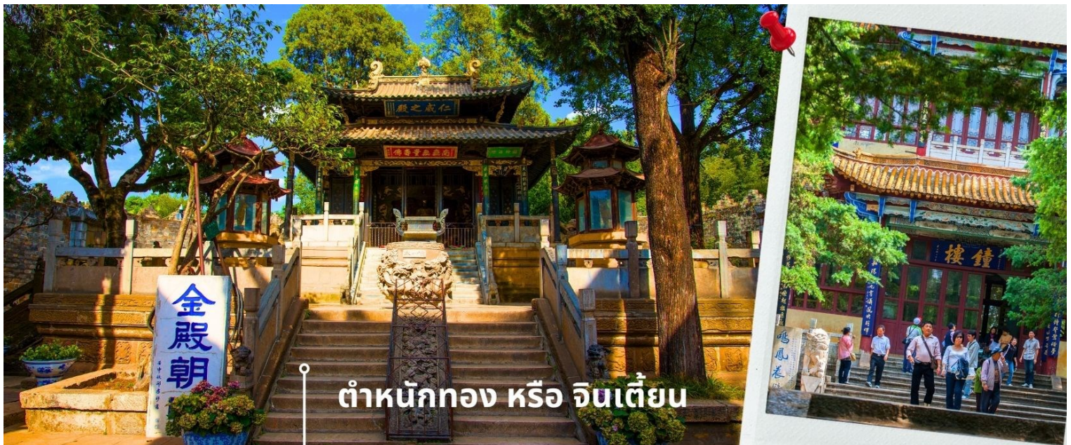
ต้าหนังกอง หรือ จินเตี้ยน

นำท่านเยี่ยมชม ต้าหนังกอง หรือ จินเตี้ยน (The Golden Temple Park | Jindian park) (ไม่รวมค่ารถแบตเตอรี่ 10 หยวน/ท่าน) โบราณสถานสำคัญของมณฑลยูนนาน ที่ได้รับการปกป้องดูแลโดยรัฐบาลจีน ตั้งอยู่บริเวณเชิงเขาหมิงเฟิง ล้อมรอบด้วยแนวกำแพงและหอคอยเหมือนเป็นป้อมปราการ ต้าหนังกองถูกเรียกตามลักษณะอาคารที่มีสีทองอร่าม จากทองเหลืองในส่วนของผนังและหลังคา รวมกว่า 200 ตัน โดยถือเป็นสิ่งปลูกสร้างสัมฤทธิ์ที่ใหญ่ที่สุดของจีน ภายในมีรูปปั้นทองโดยมีเงินอยู่ (เสวียนอู๋) เทพเจ้าลัทธิเต๋าเป็นองค์ประธาน