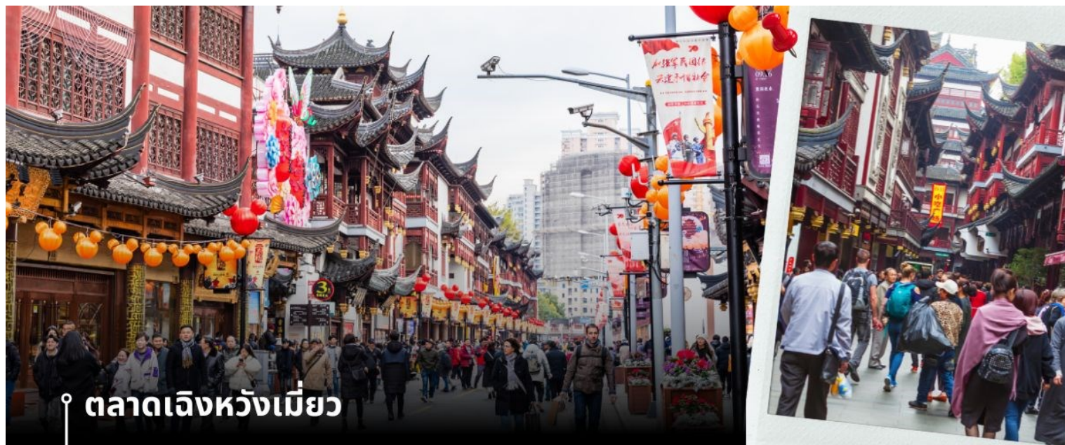
📍 ตลาดเจิ้งเหมียว

จากนั้นนำท่านสู่ ตลาดเจิ้งเหมียว เป็นศูนย์รวมสินค้า และอาหารพื้นเมืองที่แสดงถึงเอกลักษณ์ของชาวเซี่ยงไฮ้ซึ่งมีการผสมผสานระหว่างอดีตและปัจจุบันได้อย่างลงตัว ซึ่งเป็นย่านสินค้าราคาถูกที่มีชื่ออีกย่านหนึ่งของนครเซี่ยงไฮ้ ให้ท่านอิสระช้อปปิ้งตามอัธยาศัย