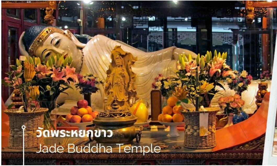
วัดพระหยกขาว Jade Buddha Temple

นำท่านชม วัดพระหยกขาว Jade Buddha Temple เป็นวัดที่มีชื่อเสียงมากที่สุดในเมืองเซี่ยงไฮ้ ซึ่งเป็นที่รู้จักจากพระพุทธรูปสององค์ที่สร้างขึ้นจากหยกทั้งแท่ง องค์พระพุทธรูปปางนั่งมีความสูง 190 เซนติเมตร และ หุ้มด้วยเพชรพลอย หิน มโนรา และ มรกต และองค์พระพุทธรูปปางไสยาสน์ มีความยาว 96 เซนติเมตร นอนเอียงด้านขวาและหนุนพระเศียรด้วยพระหัตถ์ขวา ถือเป็นวัดที่มีทั้งชาวจีนและนักท่องเที่ยวเดินทางมาสักการะบูชาตลอดทั้งวัน