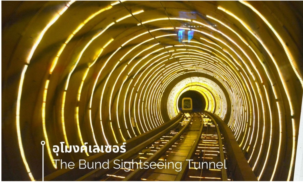
อโมงค์เลเซอร์ The Bund Sightseeing Tunnel

นำท่านสู่บริเวณ หาดไว่ทาน ตั้งอยู่บนฝั่งตะวันตกของแม่น้ำหวงผู้มีความยาวจากเหนือจรดใต้ถึง 4 กิโลเมตร เป็นเขตสถาปัตยกรรมที่ได้ชื่อว่า “พิพิธภัณฑ์สิ่งก่อสร้างหมื่นปีแห่งชาติจีน” ถือเป็นสัญลักษณ์ที่โดดเด่นของนครเซี่ยงไฮ้