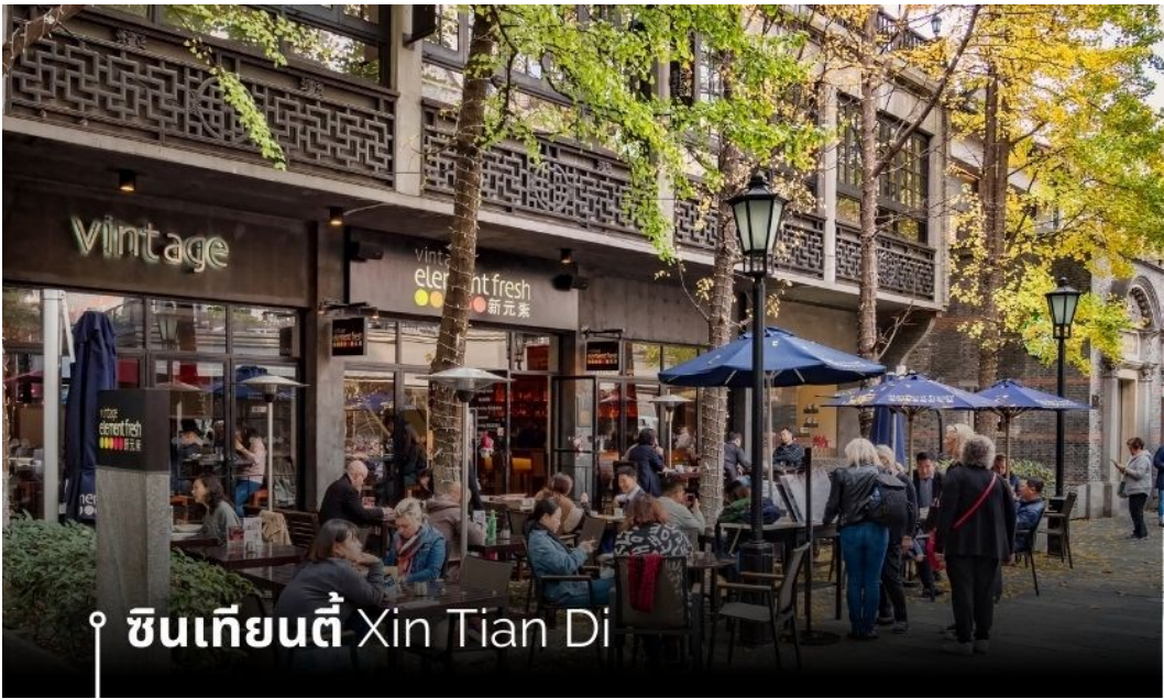
ซินเทียนตี้ Xin Tian Di

จากนั้นนำท่านเที่ยวชม ซินเทียนตี้ ย่านฮิปเตอร์ใจกลางนครเซี่ยงไฮ้ ที่วัยรุ่นต้องมา กลายเป็นสถานที่ท่องเที่ยวติดอันดับต้นๆไปแล้ว สำหรับแหล่งช้อปปิ้งแห่งนี้ ไม่แพ้แหล่งช้อปปิ้งรุ่นพี่ อย่าง ถนนนานกิง ถนนอู่เจียง Yu Yuan Bazaar ถือว่าเป็นอีก 1 ไฮไลท์เด็ดของนครแห่งนี้ เนื่องจากเอกลักษณ์ที่ไม่เหมือนใคร สิ่งปลูกสร้างที่ใช้อิฐบล็อกแบบสถาปัตยกรรมแบบ Shikumen (ซิกเหมิน) การผสมผสานระหว่างสถาปัตยกรรมตะวันตกกับจีนเข้าด้วยกัน ทางเดินหิน กำแพงหิน ประติมากรรม บ้านเมืองเก่าแต่ดูแลรักษาอย่างดี