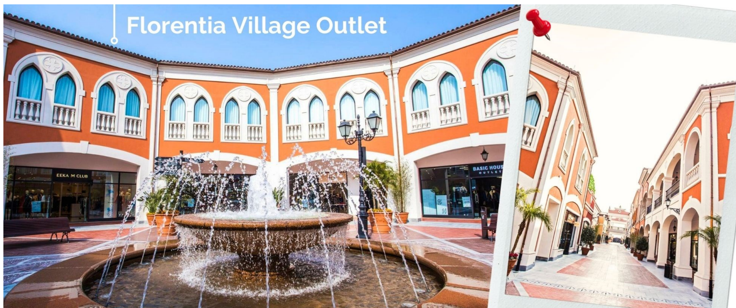
Florentia Village Outlet

นำท่านอิสระช้อปปิ้ง Florentia Village Outlet ห้างเอาท์เล็ตส์ขนาดใหญ่ที่รวบรวมแบรนด์แฟชั่นชั้นนำต่างๆ มากมายให้ท่านเลือกช้อปปิ้งไม่ว่าจะเป็นแบรนด์ BALENCIAGA, GUCCI, GUCCI, GUESS, PRADA, SAINT LAURENT PARIS, BURBERRY, ADIDAS, CONVERSE และอีกมากมายให้ท่าน ช้อปปิ้ง เป็นของฝากแก่ญาติสนิท มิตรสหาย และที่นี่เป็นมากกว่าการช้อปปิ้ง เพราะที่นี่มีเมืองจำลองในอิตาลีที่มีลำคลองและเรือกอนโตลาและ สถาปัตยกรรมยุโรปคลาสสิกจำลองสามารถถ่ายรูปเช็คอินสไตล์ยุโรปได้อีกด้วย