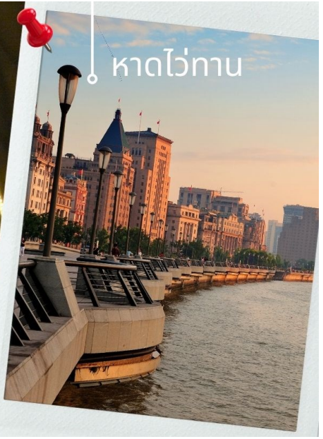
หาดไว่ทาน

จากนั้นนำท่านเที่ยวชม ซินเทียนตี้ ย่านฮิปเตอร์ใจกลางนครเซี่ยงไฮ้ ที่วัยรุ่นต้องมา กลายเป็นสถานที่ท่องเที่ยวติดอันดับต้นๆไปแล้ว สำหรับแหล่งช้อปปิ้งแห่งนี้ ไม่แพ้แหล่งช้อปปิ้งรุ่นพี่ อย่าง ถนนนานกิง ถนนอู่เจียง Yu Yuan Bazaar ถือว่าเป็นอีก 1 ไฮไลท์เด็ดของนครแห่งนี้ เนื่องจากเอกลักษณ์ที่ไม่เหมือนใคร สิ่งปลูกสร้างที่ใช้อิฐบล็อกแบบสถาปัตยกรรมแบบ Shikumen (ซิกเหมิน) การผสมผสานระหว่างสถาปัตยกรรมตะวันตกกับจีนเข้าด้วยกัน ทางเดินหิน กำแพงหิน ประติมากรรม บ้านเมืองเก่าแต่ดูแลรักษาอย่างดี