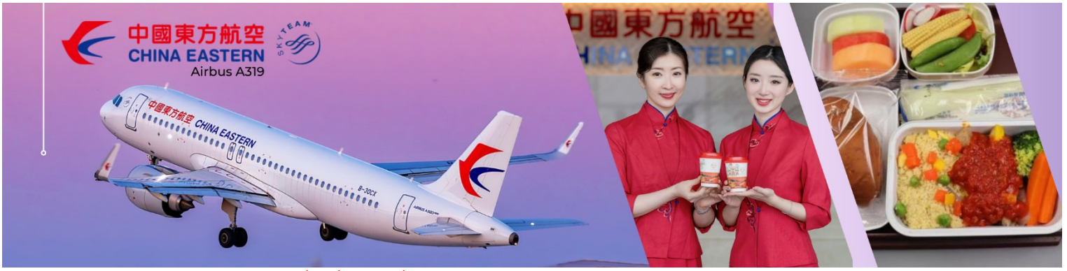
(บริการอาหารและเครื่องดื่มบนเครื่อง) (1)