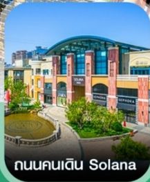
ถนนคนเดิน Solana

✈️ คอนเฟิร์มออกเดินทาง ทุกพีเรียด 2 ท่านขึ้นไป