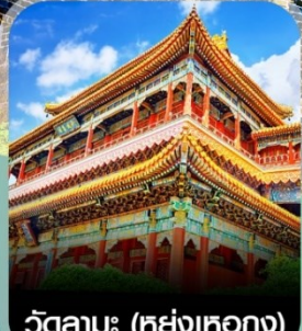
วัดลามะ (หย่งเหอกง)