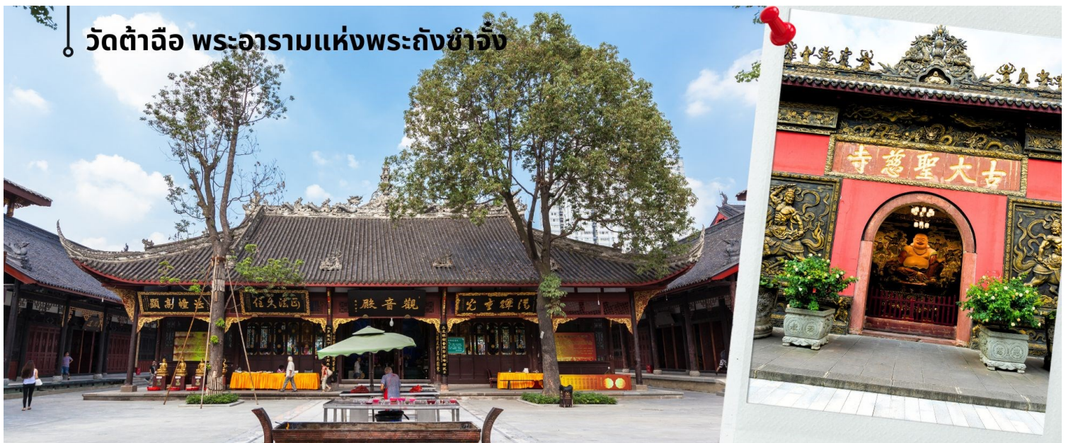
วัดต้าฉือ พระอารามแห่งพระถังซำจั๋ง