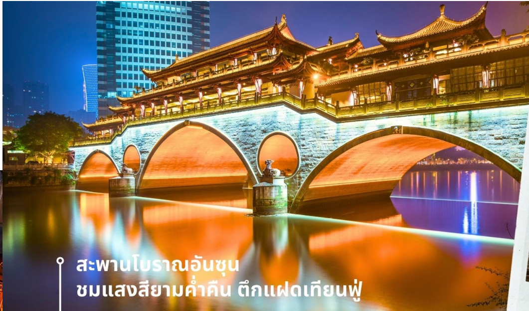
สะพานโบราณอันซุน ชมแสงสียามค่ำคืน ตึกแฝดเทียนฟู่

ชมสะพานโบราณอันซุน-พร้อมชมแสงสียามค่ำคืน ตึกแฝดเทียนฟู่ เป็นสะพานข้ามคลองที่สร้างเป็นเหมือนอาคารอยู่ข้างบน ในช่วงเวลายามเย็นจะเป็นช่วงที่ผู้คนออกมาชมบรรยากาศบริเวณของสะพานแห่งนี้ และมีร้านค้ามากมาย รวมไปถึงบาร์เครื่องดื่มต่างๆ ที่ดึงดูดนักท่องเที่ยวได้เป็นอย่างดี เป็นสะพานที่ทอดข้ามแม่น้ำจินเจียง และเป็นรูปแบบสะพานมีหลังคา ตามลักษณะสถาปัตยกรรมจีนโบราณ อายุมากกว่า 300 ปี และในบริเวณใกล้เคียงกัน ยังเป็นที่ตั้งของ ตึกแฝด