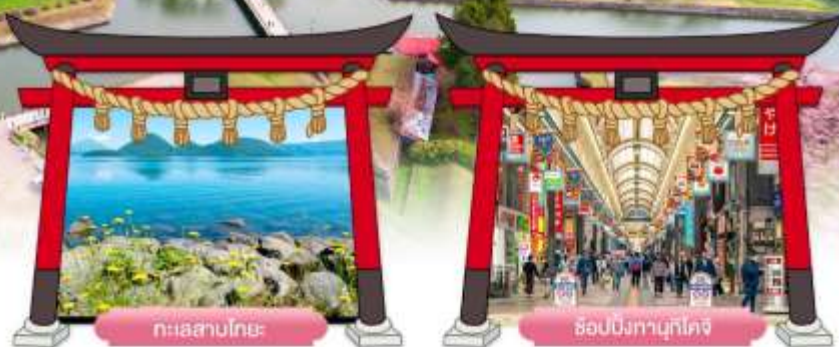
ทะเลสาบโทยะ