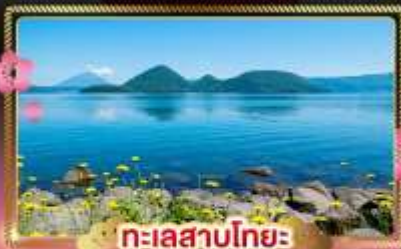
ทะเลสาบโทโยะ