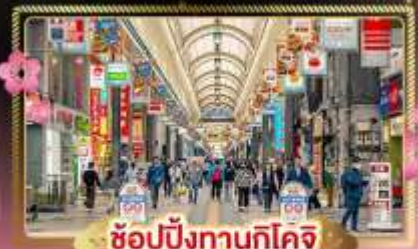
ช้อปปิ้งทานุกิโคจิ