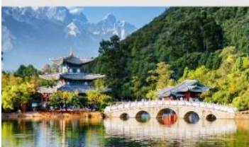
สระมังกรดำ