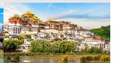
วัดลามะชงจันหลิน

*ทางบริษัทฯ ขอสงวนสิทธิ์ในการสลับโปรแกรมทัวร์ตามความเหมาะสมขึ้นอยู่กับสถานการณ์หน้างาน โดยคำนึงถึงผลประโยชน์ของลูกค้าเป็นสำคัญ