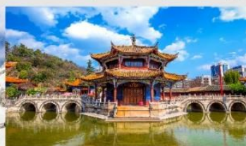
วัดหยวนทง