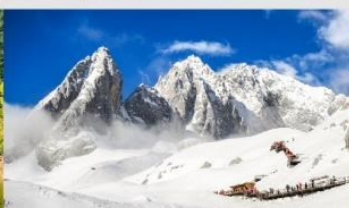
ภูเขาหิมะมังกรหยก