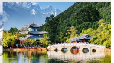
สระมังกรดำ

*ทางบริษัทฯ ขอสงวนสิทธิ์ในการสลับโปรแกรมทัวร์ตามความเหมาะสมขึ้นอยู่กับสถานการณ์หน้างาน โดยคำนึงถึงผลประโยชน์ของลูกค้าเป็นสำคัญ