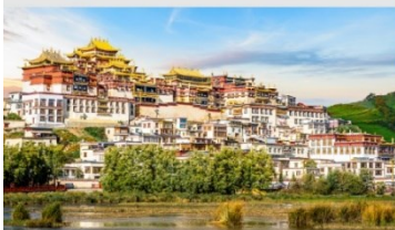
วัดลามะชงจันหลิน