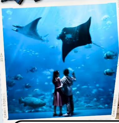
ZONE 7 : FAR FAR AWAY