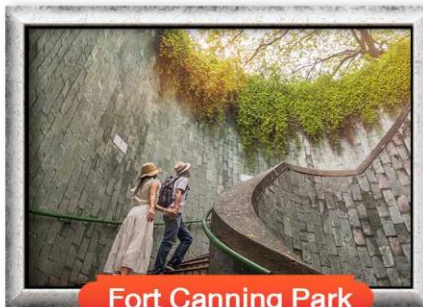
Fort Canning Park