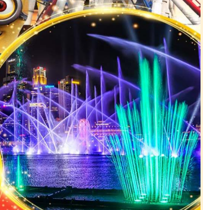
Light & Water Show