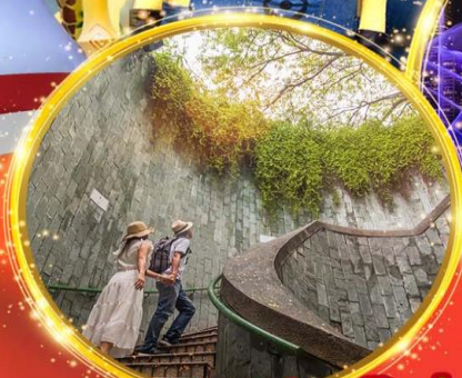
Fort Canning Park