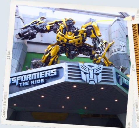
ZONE 1 : HOLLYWOOD