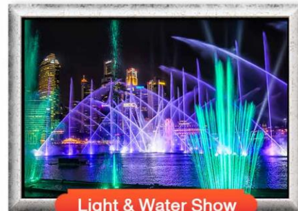
Light & Water Show