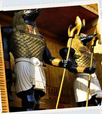
ZONE 2 : NEW YORK