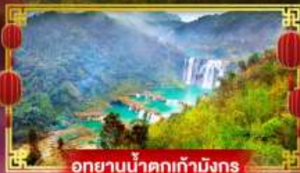
อุทยานน้ำตกเก้ามังกร