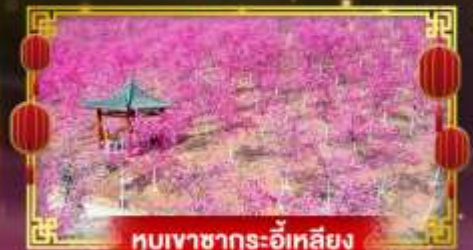
หุบเขาซากระ้อีหลียง