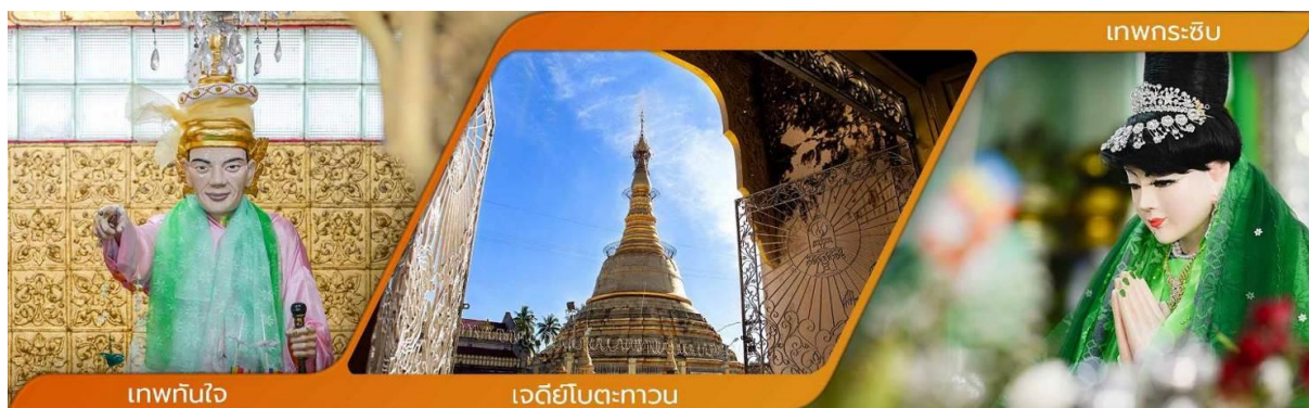
เทพทันใจ

คำบูชาเทพทันใจ เอहि สักกะ มหานัทโปะโปะจีโปตะถ่องสิทธิมัตถุ อิทังพะลัง เอตัสสะมิงรัตตะนัง พุทธัง ธัมมัง สังฆัง เทวานัง ประสิทธิลาโภ ขยโยนิจจัง วันทามิสัพพะทา สวาโหม