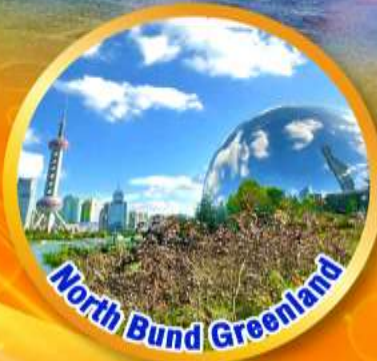
North Bund Greenland