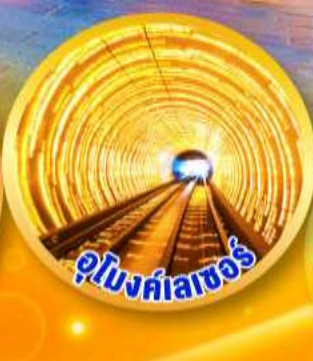
อุโมงค์ลาเซอร์