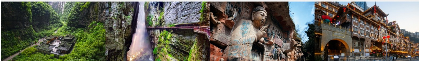
อุทยานแห่งชาติหลุมฟ้า 3 สะพานสวรรค์