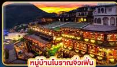
หมู่บ้านโบราณจื่อเฟิน