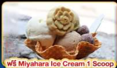
ฟรี Miyahara Ice Cream 1 Scoop

"ขอความรักวัดหลงซาน" ปล่อยโคมลอยเส้นทางรถไฟผิงซี