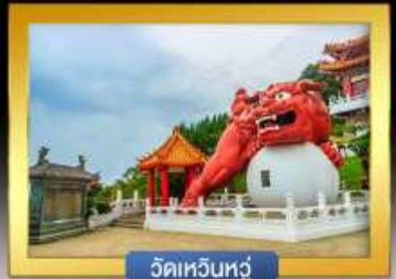
วัดเหวินหัว