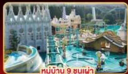
หมู่บ้าน 9 ขนเผ่า