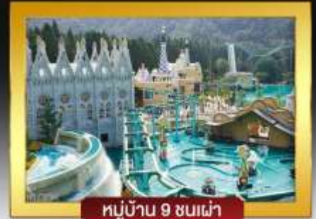
หมู่บ้าน 9 ซนเผ่า