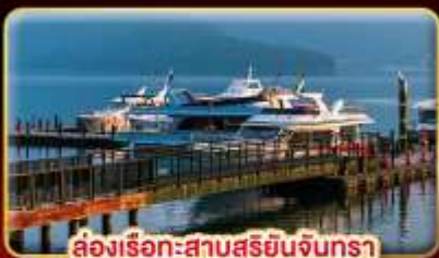
ล่องเรือ-सानสุริยอินจินตรา