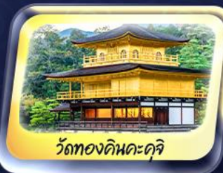
วัดทองคินคะคุจิ

สายการบิน AirAsia X (XJ) น้ำหนักกระเป๋า 20 KG