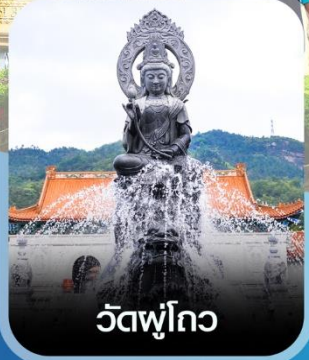
วัดพุทไธ