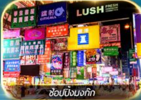
ช้อปปิ้งมงก๊ก

เต็มอิ่มทั้งบุญ และ ช้อปปังแบบจัดเต็ม จิมซาจุ้ย มงก๊ก