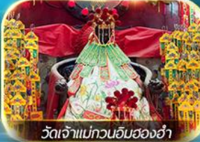
วัดเจ้าแม่ทวนอิมของฮ่า