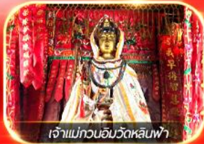
เจ้าแม่กวนอิมวัดหลินฟ้า