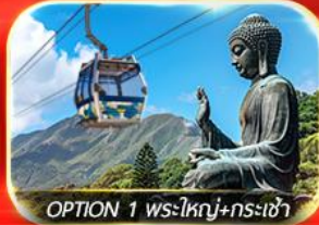
OPTION 1 พระใหญ่+กระเช้า