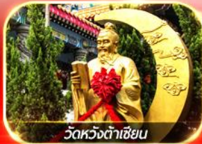
วัดหวังต้าเซียน