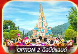
OPTION 2 ดิสนีย์แลนด์

เต็มอิ่ม ทั้งไหว้พระ-ขอพร การเงิน การงานความรักและ-ซ้อปปิ้ง