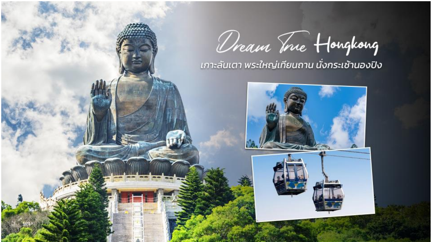
Dream True Hongkong เกาะลันเตา พระใหญ่เทียนถาน นั่งกระเช้านองปิง

ประติมากรรมทางพุทธศาสนาที่มีการผสมผสานระหว่างศิลปะสำริดแบบดั้งเดิมกับเทคโนโลยีสมัยใหม่ ชาวฮ่องกงเชื่อว่า หากใครได้มานมัสการขอพรองค์พระใหญ่แห่งนี้แล้ว ชีวิตก็จะมีแต่ความโชคดี มีความสุขสมหวัง และประสบความสำเร็จในทุกๆด้าน หลังจากไหว้พระแล้วท่านสามารถเลือกซื้อของฝาก, ของที่ระลึก จากหมู่บ้านนองปิง อาทิเช่น หยก ไข่มุก หรือเครื่องประดับคริสตัล เพื่อเป็นของที่ระลึก จากนั้นนั่งกระเช้ากลับลงมายังสถานี Tung Chung