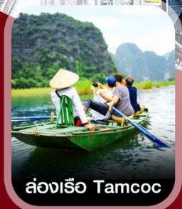
ล่องเรือ Tamcoc