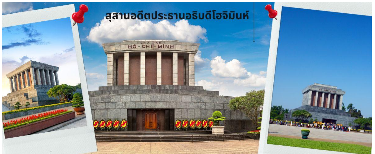
สุสานอดีตประธานาธิบดีโฮจิมินห์

จากนั้นนำท่านเข้าสู่ สุสานอดีตประธานาธิบดีโฮจิมินห์ (ชมด้านนอก) อยู่ที่ จัตุรัสบาติงห์ ใจกลางกรุงฮานอยเป็นสถานที่เก็บศพภายในบรรจุศพอาบนํ้ายาของโฮจิมินห์นอนสงบอยู่ในโลง