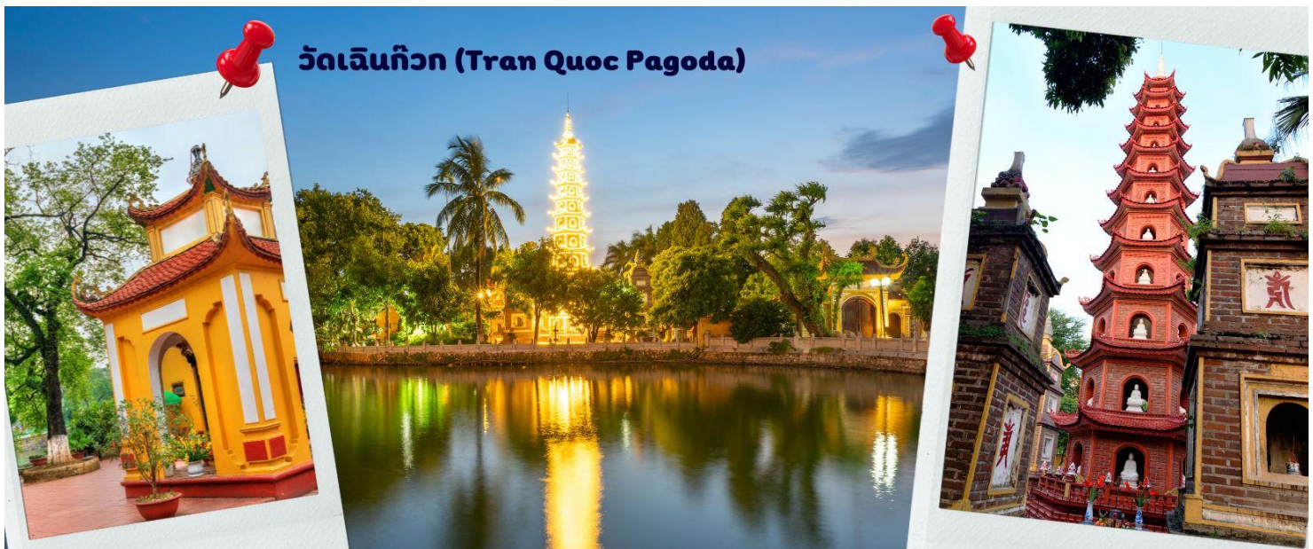
วัดเจินก๊วก (Tran Quoc Pagoda)

จากนั้นนำท่านไป วัดเจินก๊วก (Tran Quoc Pagoda) เป็นวัดที่อยู่ใจกลางเมืองของเวียดนาม ใกล้ชิดกับทะเลสาบตะวันตกของเมืองฮานอย สร้างด้วยสถาปัตยกรรมจีนโบราณ มีความร่มรื่น และบรรยากาศดี จึงเป็นที่นิยมของนักท่องเที่ยวทั้งที่ชื่นชมความงามและมีศรัทธาในพระพุทธศาสนา จากภาพมุมสูงของสถานที่ตั้ง ที่นี้เหมือนตั้งอยู่บนเกาะที่ยื่นลงไปทะเลสาบ แต่มีเส้นทางคมนาคมเข้าถึงที่ สิ่งปลูกสร้างมีการวางผังเป็นอย่างดี ใช้สีสันทึบกลมกลืนในโทนสีเหลือง น้ำตาล ตัดกับสีเขียวของต้นไม้ใหญ่ที่โอบล้อมอยู่ในมุมถ่ายภาพจากอีกฝั่งหนึ่ง จะเห็นสิ่งปลูกสร้างสไตล์จีน และเจดีย์หลายชั้นโดดเด่น มีภาพที่สะท้อนลงสู่ผืนน้ำ เป็นภูมิทัศน์ที่งดงามทั้งยามกลางวันและยามค่ำคืนที่มีการ