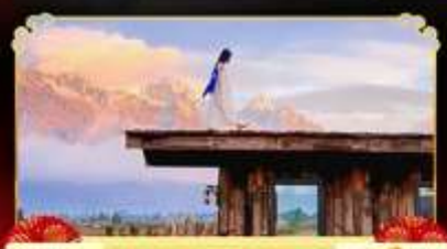
YUN TI YANG CAFE