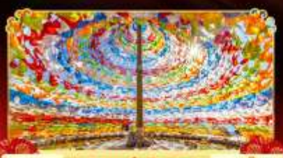
รมนต้อฮิชฐาน