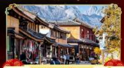
เมืองท่าไปซา