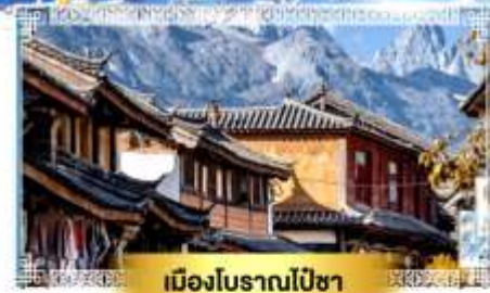
เมืองโบราณไป๋ซา