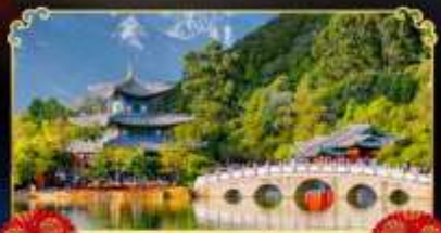
สระมิงกรคำ