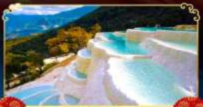
โป๋สุ่ยโต

นั่งกระเช้าขึ้นหุบเขาพระจันทร์สีน้ำเงิน ชมวิว "นาพาไห่" ทะเลสาบทุ่งหญ้าที่ดีที่สุด