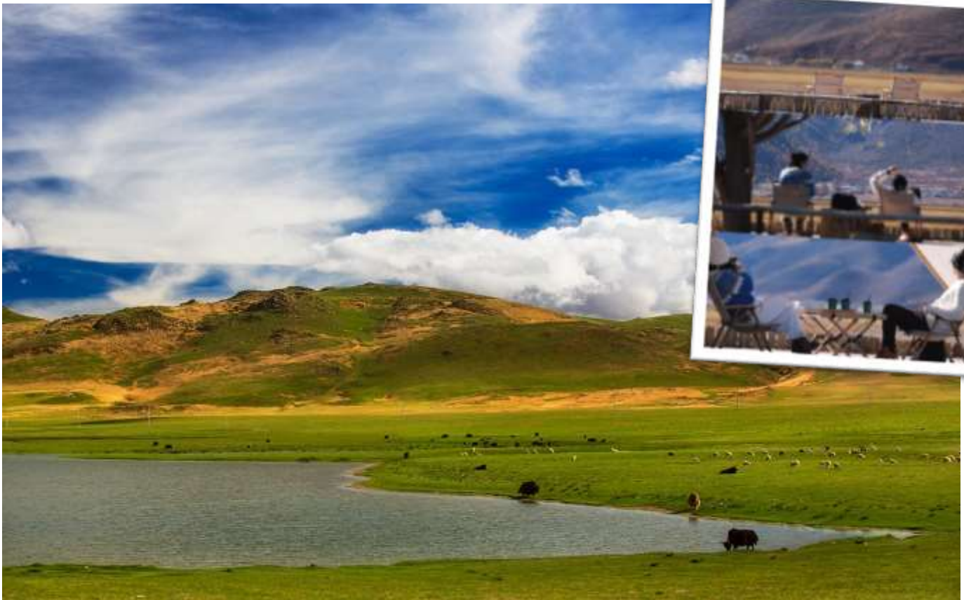
หมายเหตุ: ทิวทัศน์ขึ้นอยู่กับฤดูกาลและสภาพอากาศ

นำท่านชมความสวยงามของ ทุ่งหญ้านาผาไท อยู่สูงจากระดับน้ำทะเลกว่า 3,000 เมตร เป็นทะเลสาบที่ราบสูงตามฤดูกาล บางครั้งก็เป็นทะเลสาบพื้นที่ชุ่มน้ำที่ราบสูง บางครั้งก็เป็นทุ่งหญ้าอัลไพน์ Guiqing Grassland มีทั้งฝูงม้า ฝูงจามรี ทะเลสาบ และทุ่งหญ้าสีเขียวขจีรวมอยู่ในที่เดียว วิถีข้างหลังเป็นภูเขาโอบล้อมทะเลสาบ นอกจากนี้ ยังสามารถเข้าสู่จุดพื้นเมืองทิเบตมาใส่ถ่ายรูปที่นี่ได้อีกด้วย และแวะถ่ายรูปเชคอิน ชิมกาแฟที่คาเฟ่ BLACK BEAN COFFEE HOUSE (ไม่รวมค่าเครื่องดื่ม)