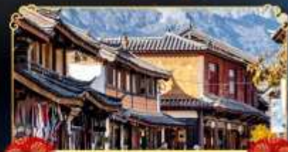
เมืองโบราณโปซซา