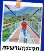
สะพานกระจก