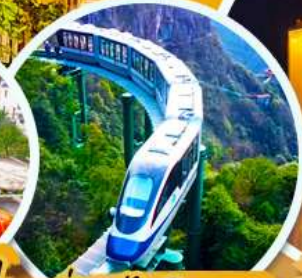
นั่งรถไฟรมพา