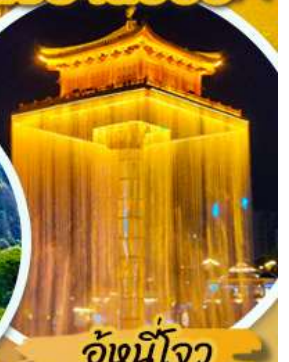
อุ้งมือโจว

เมนูพิเศษ !! อิ่มอร่อยกับบุฟเฟ่ต์ชาบู และ ปิ้งย่าง พร้อมเครื่องดื่ม