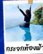
กระจกท้องฟ้า