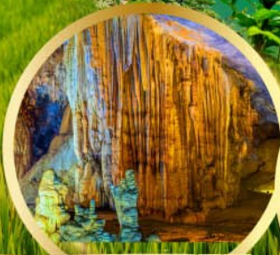
น้ำสวรรค์