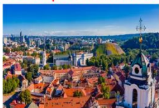
Vilnius Old Town