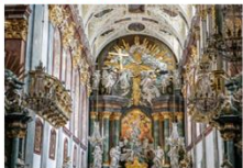
อารามจัสนา โกรธา

** พักที่ Mercure Cemtrum Hotel 4* หรือเทียบเท่า **