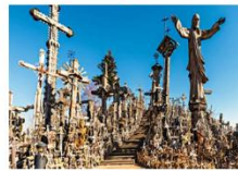
Hill of Crosses