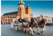
Krakow Old Town

05.15 น. เดินทางถึงสนามบินอิสตันบูล และเปลี่ยนเครื่อง 07.25 น. ออกเดินทางสู่สนามบินคราคอฟ เที่ยวบิน TK1271 08.45 น. เดินทางถึงสนามบินคราคอฟ ประเทศโปแลนด์