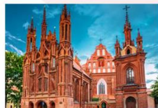
โบสถ์เซนต์แอน