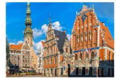
เมืองริกา

** พักที่ Bellevue Park Hotel Riga 4* หรือเทียบเท่า **