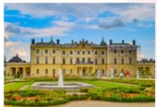
พระราชวัง Branicki