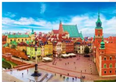
จัตุรัสเมืองเก่า