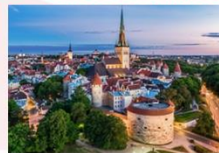
Tallinn Old Town