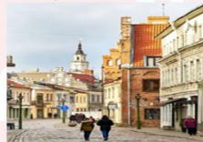
Kaunas Old Town

** พักที่ Holiday Inn Vilnius Hotel 4* หรือเทียบเท่า **