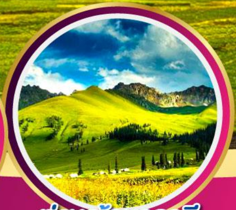
ทุ่งหญ้านาลาดิ