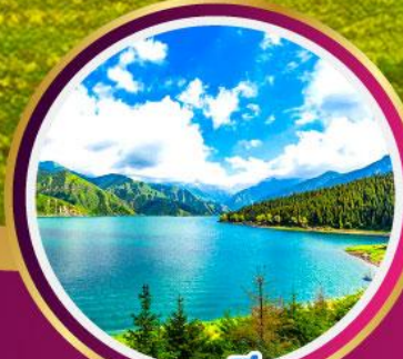
ทะเลสาบเทียนชาน