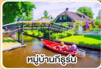
หมู่บ้านทึร์น