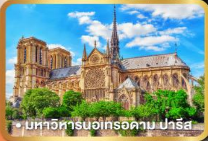
• มหาวิหารนอเทรอดาม ปารีส