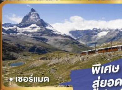
• เซอร์แมต