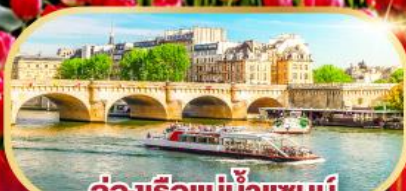
ล่องเรือแม่น้ำแซนน์