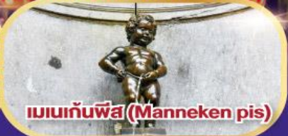
แมนเกินพีส (Manneken pis)