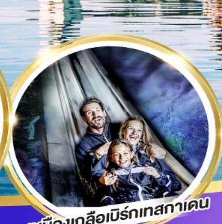
เหมืองเกลือเบิร์กเทศาเดิน