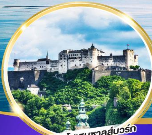
ปราสาทไฮเซนซาลส์บวร์ก