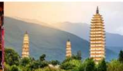
เจดีย์สามองค์

*ทางบริษัทฯ ขอสงวนสิทธิ์ในการสลับโปรแกรมทัวร์ตามความเหมาะสมขึ้นอยู่กับสถานการณ์หน้างาน โดยคำนึงถึงผลประโยชน์ของลูกค้าเป็นสำคัญ