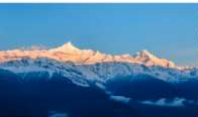
ภูเขาหิมะเหมยลี่