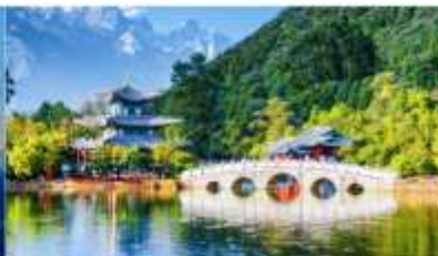
สระมิงกรดำ