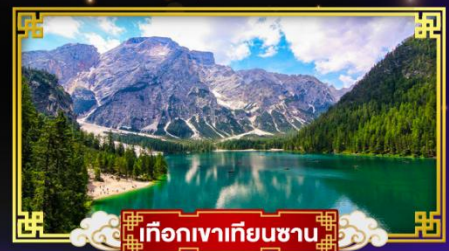
เทือกเขาเทียนชาน