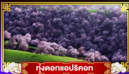
ทุ่งดอกแอปริคอต