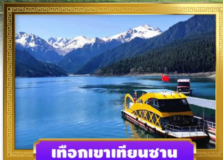
เทือกเขาเทียนชาน