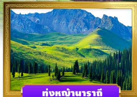
หุบหญ้านาราตี