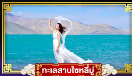
ทะเลสาบไซหล่มู่