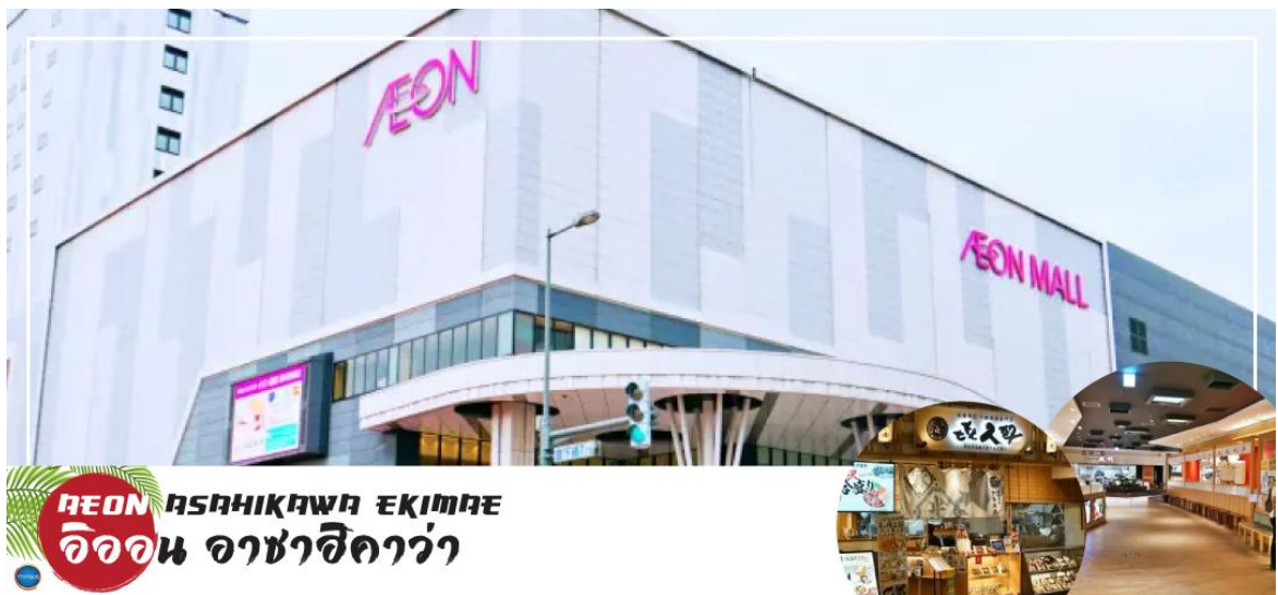
AEON ASAHIKAWA EKIMAE อียอน อาซาฮิคาว่า

นำท่านช้อปปิ้ง ณ อียอน อาซาฮิคาว่า (AEON Asahikawa Ekimae) ห้างสรรพสินค้าขนาดใหญ่ของอาซาฮิคาว่า อิสระให้ท่านได้เลือกซื้อของฝาก ของที่ระลึกกัน อาทิ ขนมโมจิ เบนโตะ ผลไม้ และขนมขึ้นชื่อของญี่ปุ่น อย่าง คิทแคท สามารถหาซื้อได้ที่นี้เช่นกัน