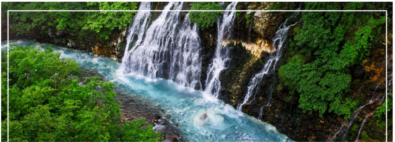
SHIRAHIGE WATERFALL น้ำตกชิราฮิเกะ

วันที่สอง ท่าอากาศยานนิวซีโดเสะ สอกโกโด – เมืองบิเอะ – น้ำตกชิราฮิเกะ – สระอะโออิเคะ หรือ บ่อน้ำสีฟ้า – เมืองอาซาฮิคาว่า – อีออน อาซาฮิคาว่า