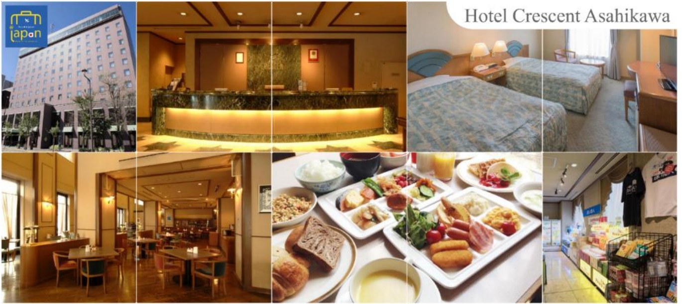
Hotel Crescent Asahikawa