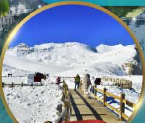
ต่ากู่กลาเซียร์