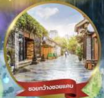
ชอยกว้างชอยแคบ