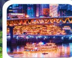
"ล่องเรือชมฉงชิ่ง"