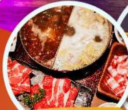
เมนูพิเศษ