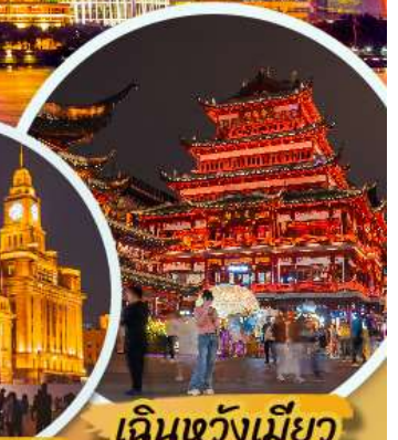
เดินวังเมี้ยว

***เมนูพิเศษ : เสี่ยวหลงเปา , ชาบูหม่าล่า *** เที่ยวแบบสบายๆ ไม่ลงร้านรัฐบาล ***