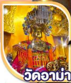
วัดอาน่า