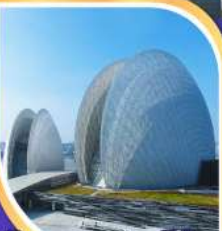
โรงละครหอยไข่มุก