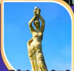
จูไห่พีชเชอร์ทีร์รา